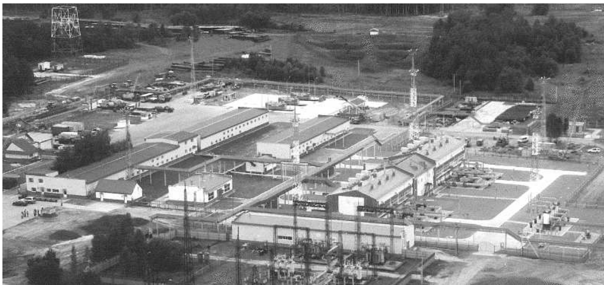
Рисунок 1 – Реконструкція електроприводних компресорних станцій. Газопровід ГПЗ – Парабель – Кузбас ТОВ «Газпром трансгаз Томск» КС Парабель

спортного об'єднання і значно зменшити чисельність персоналу.